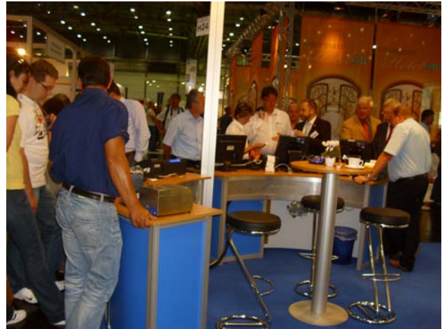
Besucherandrang am SCHULTES Messestand

Mit der Live Stream Aufzeichnung haben Betriebsinhaber die Möglichkeit, den Geldfluss optimal zu kontrollieren. Dank der Anbindung eines Video-systems, kombiniert mit eingeblendeten Transaktionsdaten des Kassenterminals, ist eine kundenorientierte und gewinnbringende Filialführung problemlos möglich.