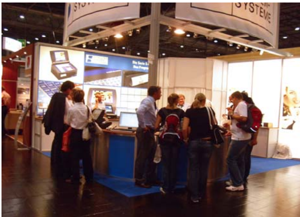
Die interessierten Messebesucher lassen sich die Vorteile der innovativen SCHULTES Produkte erklären